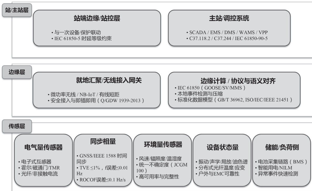
图1 电力智能传感器网络

我国自20世纪60年代开始研究传感技术,经过几十年的努力,在传感器原理、材料、制造工艺和检测等方面不断取得进展,并逐步建立起较为完善的标准和检测体系。面向电力行业应用,已经发布了多个层级的标准,初步形成了电力传感技术标准体系。整体而言,该体系可分为基础通用标准和应用领域标准两大部分:基础通用标准涵盖术语定义、分类编码、基本性能要求、试验方法、通信接口等共性要求;应用领域标准则针对发电、输电、变电、配电、用电各环节的具体传感设备提出技术规范 and 测试方法。这种“通用+专业”并行的标准架构已在工程实践中得到验证,尤其是在光纤传感、动态电能计量、配用电侧状态感知等领域沉淀出了可复用的指标体系和试验方